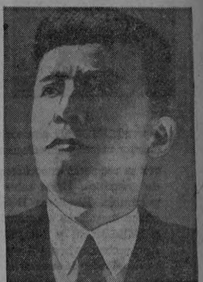
KIM IL SUNG

Se niega a que la Cruz Roja internacional inspeccione los campos de prisioneros en Corea en nota que contesta a Ridgway.